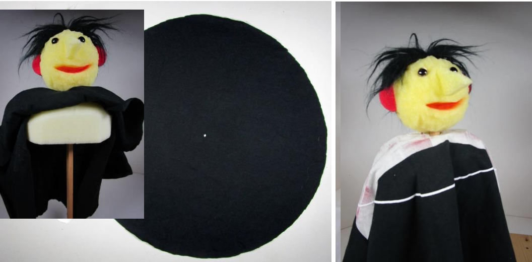
Stabpuppe ab 4 bis 7 Jahre (neu)