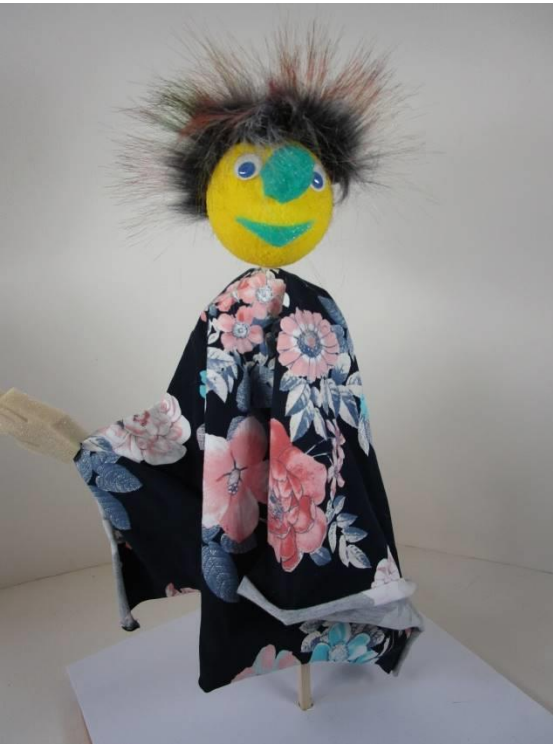
Puppenkleid quadratisch: 50 x 50 cm