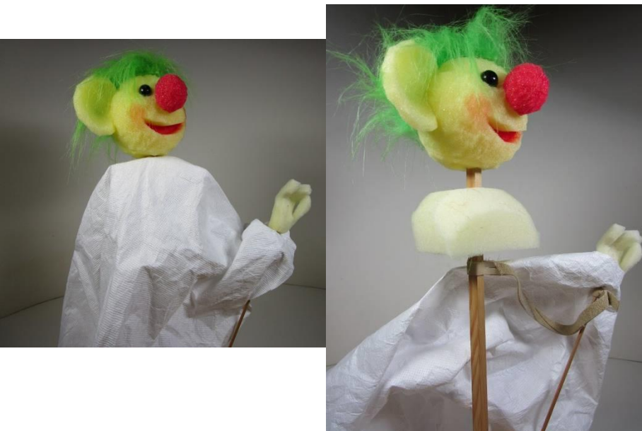
Stabpuppe für die Klassenstufe 1 bis 5 (neu)