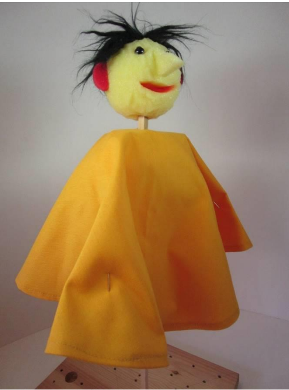
Puppenkleid rund: 50 cm Durchmesser