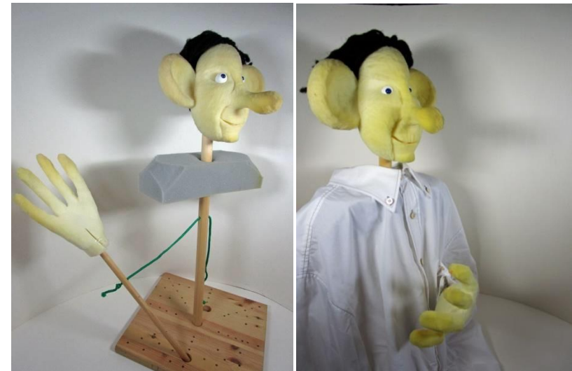
Stabpuppe für die Klassenstufe 4 bis 10 (neu)